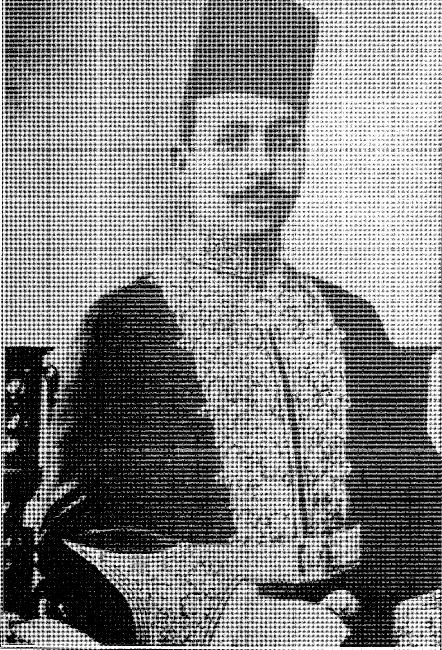
مصطفى كامل نذر حياته للدفاع عن مصر ضد الإنجليز